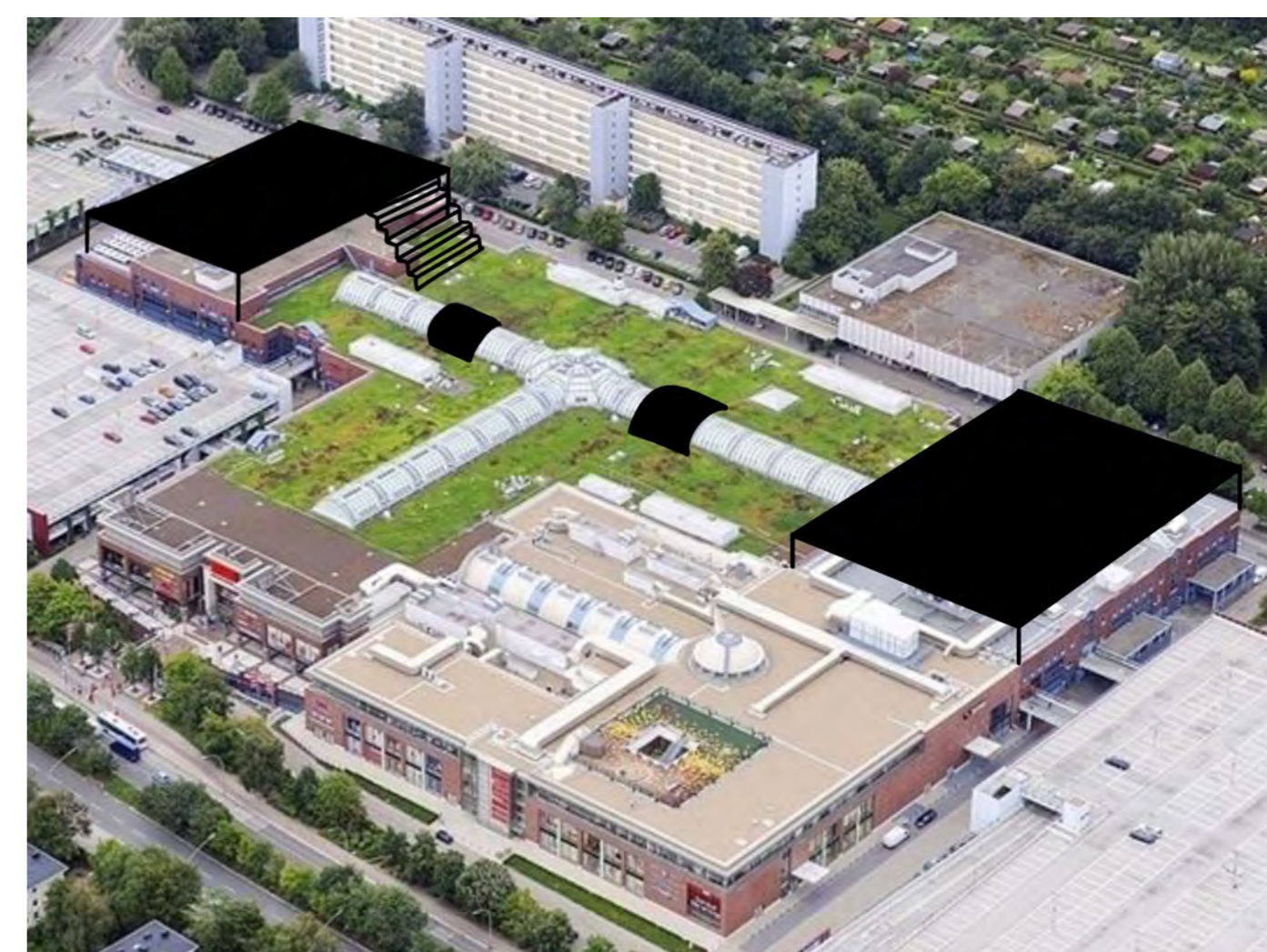
“Grün von Oben” des Teams © “KeinSchlaf” (Alter bis 18 Jahre). Zugängliche Dächer auf dem Elbe Einkaufszentrum in Osdorf.