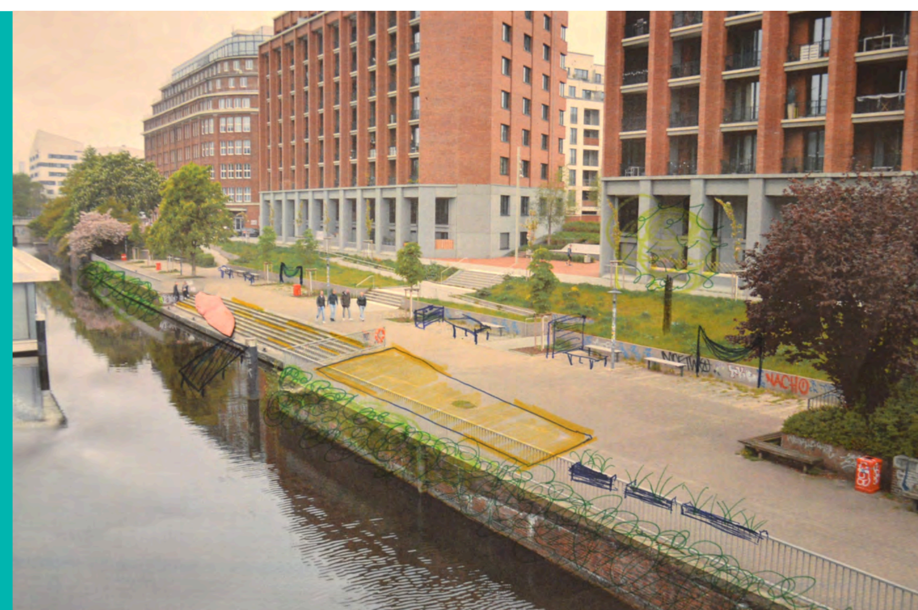
“Mitten am Kanal für alle” von © Jorid L. (Alter ab 18 Jahren). Eine ansprechende Ufergestaltung des Mittelkanals soll Mensch und Tier zum Verweilen einladen.